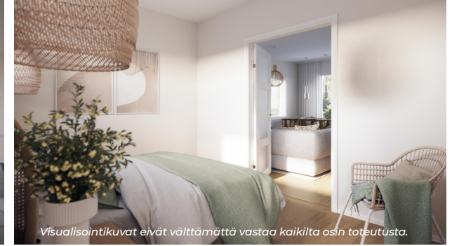
Visualisointikuvat eivät välttämättä vastaa kaikilta osin toteutusta.